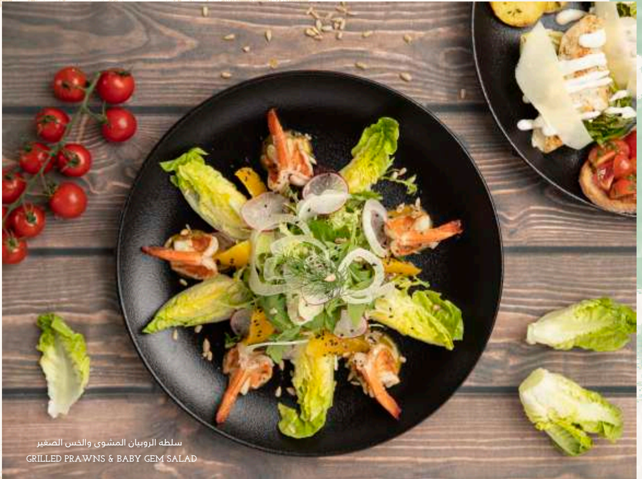
سلطة الروبيان المشوي والخس الصغير GRILLED PRAWNS & BABY GEM SALAD