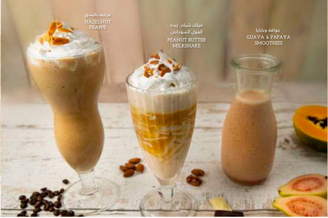
فرايبه بالبندق HAZELNUT FRAPPÉ