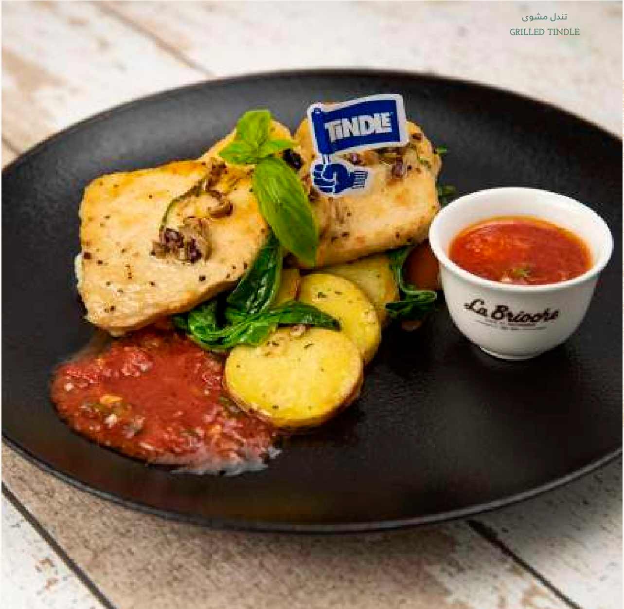
تندل مشوى GRILLED TINDLE