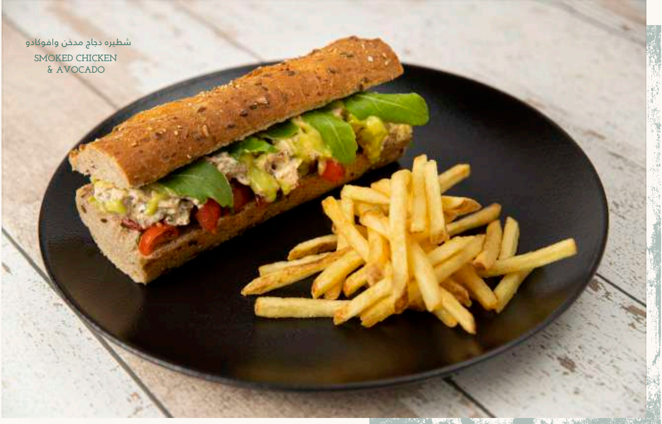
شطيره دجاج مدخن وافوكادو SMOKED CHICKEN & AVOCADO

All our sandwiches are served with French fries or assorted lettuce leaves