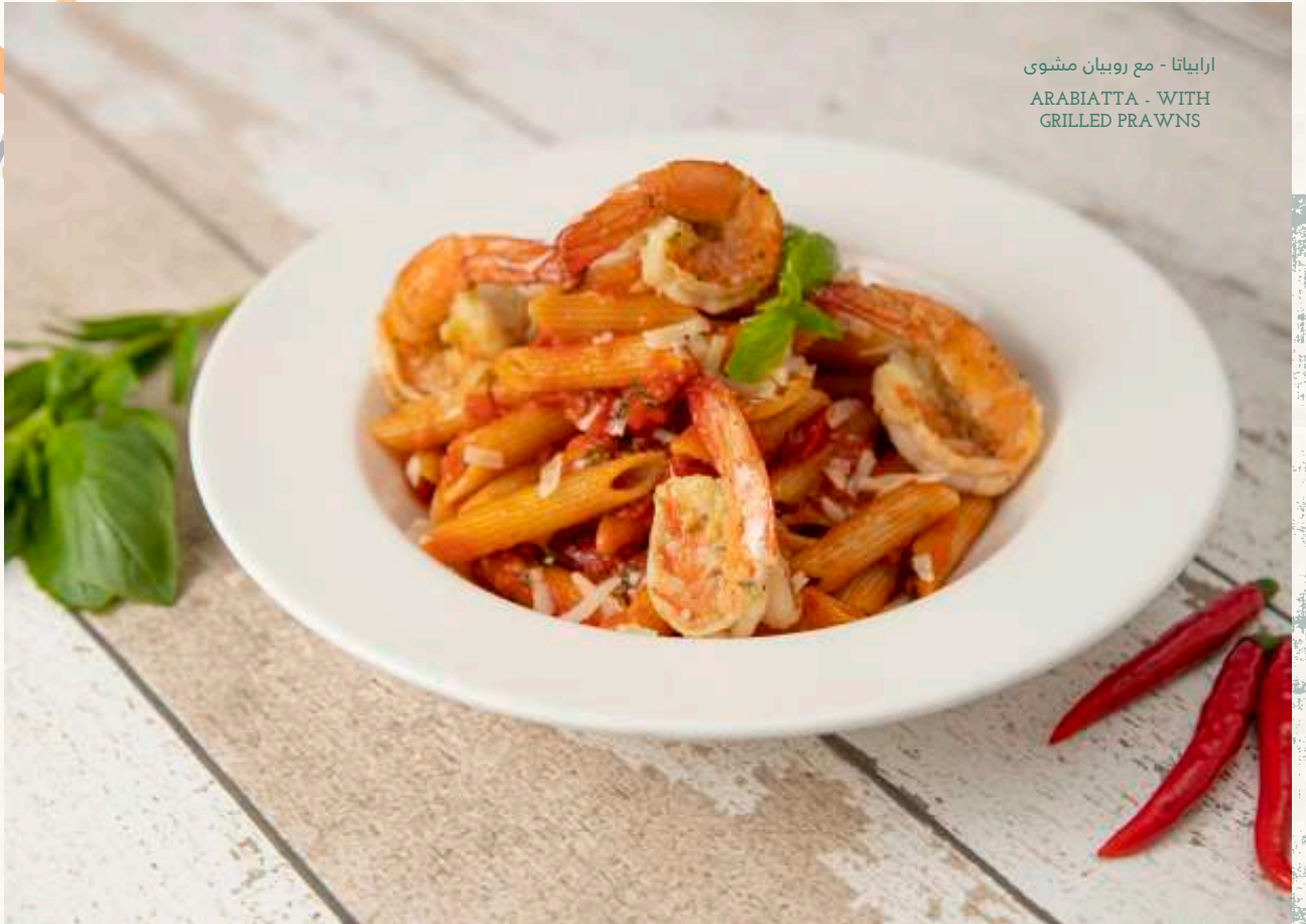
ارابياتا - مع روبيان مشوى ARABIATTA - WITH GRILLED PRAWNS