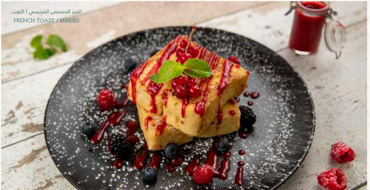
الخبز المحمص الفرنسي / التوت FRENCH TOAST / BERRIES