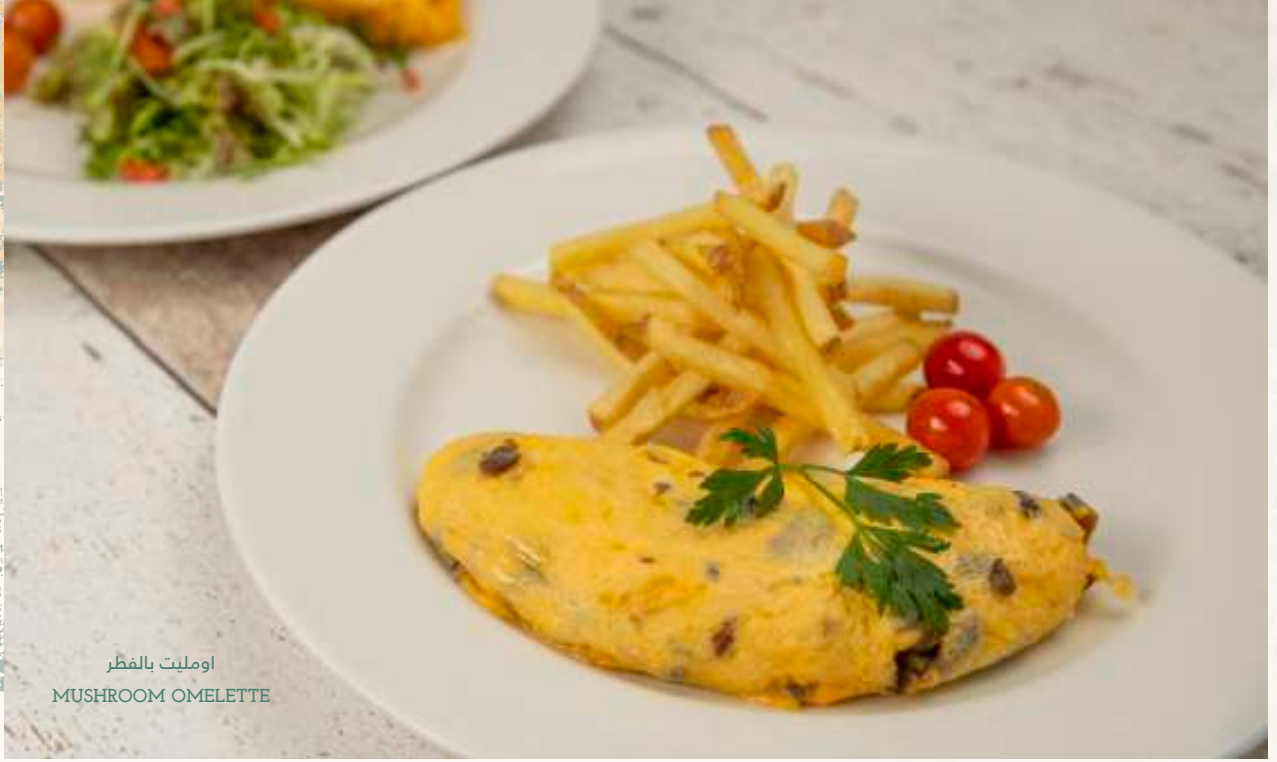
اومليت بالفطر MUSHROOM OMELETTE