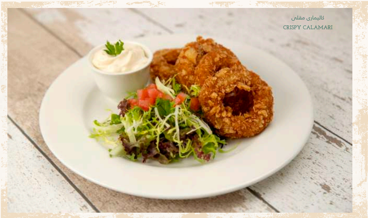
كاليمارى مقلى CRISPY CALAMARI